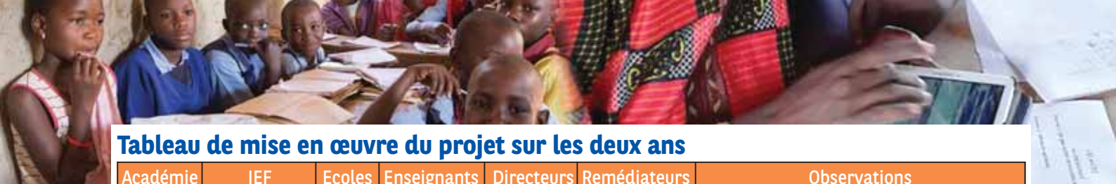
Tableau de mise en œuvre du projet sur les deux ans